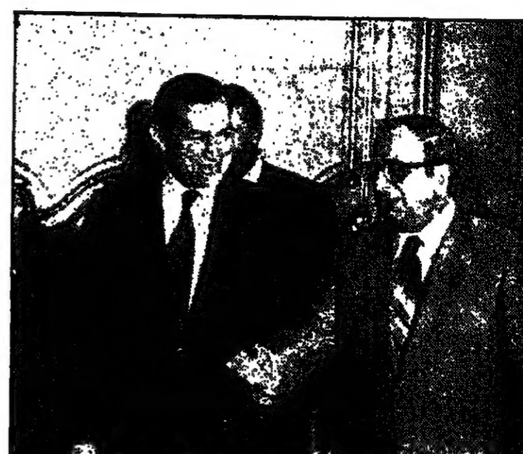
الرئيس ناسون اثناء مأدبة الغداء التي اقامها على شرفه السيد حسني مبارك نائب الرئيس السادات .